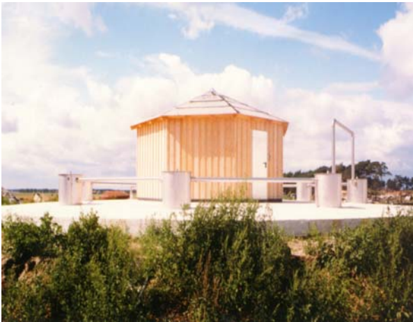
Der Fermenter ist vollkommen im Boden eingelassen und fügt sich sehr gut in die betriebliche Umgebung ein. Im Schutzhaus auf der Fermenterdecke ist die komplette Gas-aufbereitung untergebracht.

Diese Situation führte zur Überlegung, die Entsorgung des Betriebes neu zu ordnen. Wir wurden mit der Ausarbeitung eines Konzeptes zur Kostenreduktion beauftragt und erarbeiteten in einer Realisierbarkeitsstudie einen interessanten und umweltgerechten Entsorgungsweg.